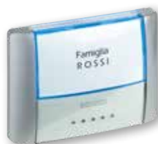
26108L - 26108N - 26108T